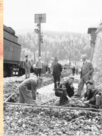
Bahnhof Semmering. 1936 wurden die Gleise neu verlegt. Das Flügelsignal steht auf »Halt«.