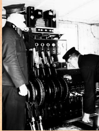
Die provisorische Verkehrsstelle »Adlitzgraben« mit Blockapparat und Hebelbank, 1937.